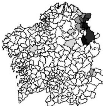
Cognome Lombardero (CAG)

Si tratta di una dinastia conosciuta e documentata, che giunse a Santalla d'Ozcos (occidente delle Asturie, di lingua galiziana), proveniente dal Paese Basco, dove erano esperti nella lavorazione del ferro; alternarono il loro cognome con Lombardía . In questa zona limite della Galizia iniziarono a lavorare nelle fucine, e in seguito si specializzarono nella fabbricazione di orologi, lavoro in cui furono i leader al tempo (si veda LANDEIRA SÁNCHEZ 1956). Ancora oggi i loro discendenti sono concentrati in questa zona della Galizia al confine con le Asturie, come si può vedere nella cartina corrispondente. Giunse in Galizia con la forma castiglianizzata, sebbene ad oggi nel complesso spagnolo è Lugo il luogo in cui vi sono più residenti con questo cognome, poi nelle Asturie e infine in Biscaglia, tracciando il percorso che ha seguito il cognome, secondo la tradizione di famiglia.