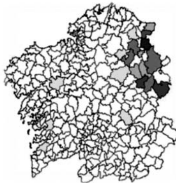
Cognome Lombardía (CAG)