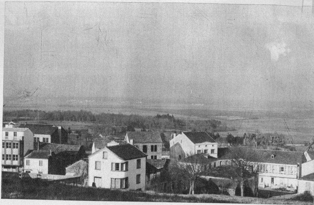
Vista panorámica da Terra Cha, desde a Feira do Monte. Os pobos que se ven branquexar ó lonxe foron creados polo Instituto Nacional de Colonización.

tañas del Cordal de Nada y la Sierra de Meira; al Sur, por la Sierra de Fitoiro y Cordal de Ousá, y al Oeste, por la Sierra da Loba y el Cordal de Montouto; casi todo el partido judicial de Villalba y mucha parte de los ayuntamientos de Otero de Rey, Castro de Rey y algo de Abadín". A Terra Cha ó gran escritor Angel Fole (8) pródexolle esta impresión: "Terra Cha. Tierra llana, llana tierra. Lo extraño en el galaico paisaje. La grave y austera belleza de la estepa. Los caminos sin sorpresas. Siempre se saben de donde vienen y a donde van. Se les ve venir de muy lejos y perderse en el horizonte. También el silencio parece que tiene distancias, distancias azules como la lejanía. Llanto de plata del abedul sobre el agua estantía. Los ríos son más callados".