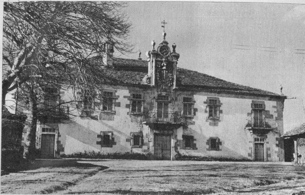
Fachada principal do Pazo de Sistallo (Cospeito). Trátase do pazo máis fermoso e mellor conservado da Terra Cha luguesa.